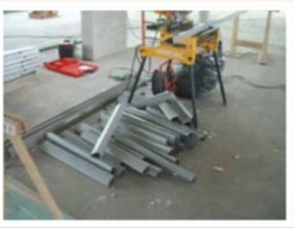
Une gestion de déchets au plus près du poste de travail