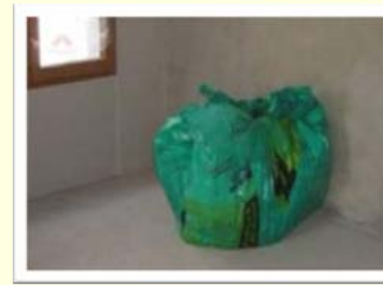
Stockage des chutes pour évacuation