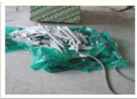
Regroupement des chutes placo