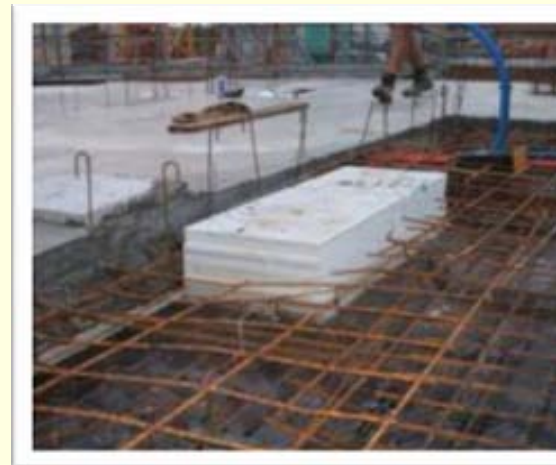
Réservation en béton cellulaire