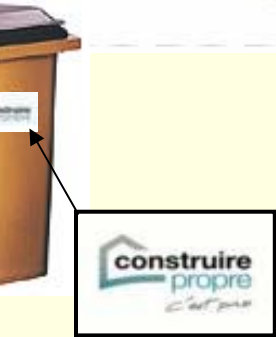
collants 4x4 et 15x10 cm