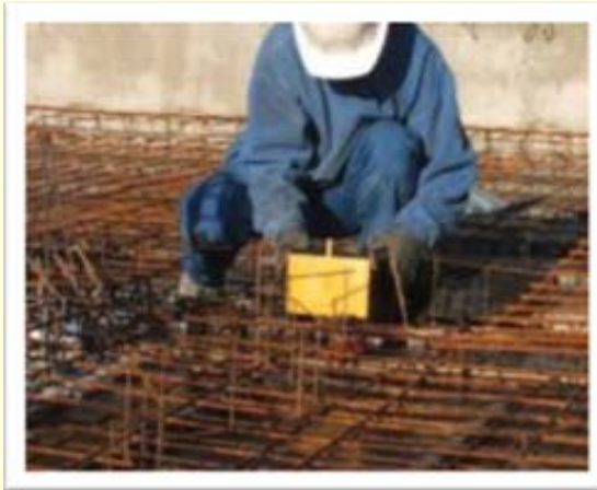
Boîte plomberie (piedevre) à intégrer au coulage du plancher