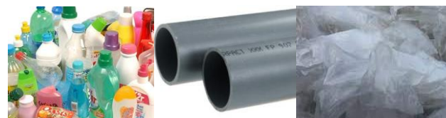
Les plastiques (films, PVC, PE, PP,...)