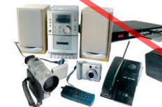
DEEE: Déchets d'équipement électrique et électronique