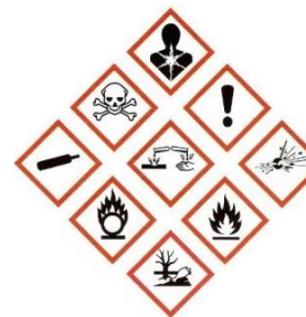
Déchets ou emballages de produits dangereux