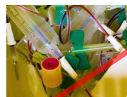
Déchets d'activité de soin