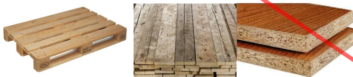
Bois: A (non traité), B (traité: aggloméré, ameublement,...), C (dangereux)