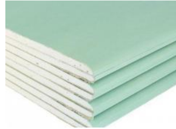
Plaque de plâtre cartonée