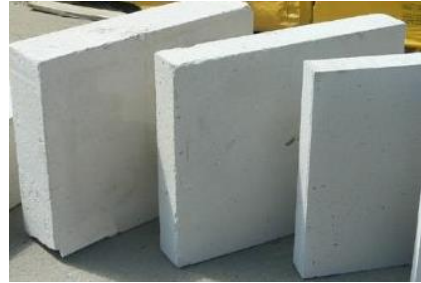
Carreau de plâtre