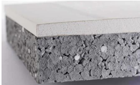
Plaques avec complexe isolant de doublage : laine de verre, laine de roche, polystyrène, mousse de polyuréthane