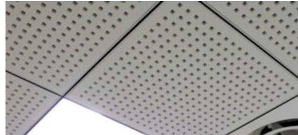
Dalle de plafond en plâtre

Ils peuvent contenir en faible quantité (< à 10% du poids) : - rails et montants métalliques - bois et plastiques - gaines et matériel électrique - revêtements, tissus fibres de verre - traces de carreaux de faïence - carton emballage