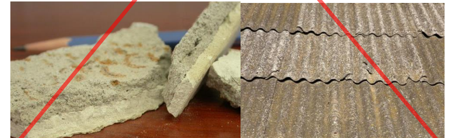
Produit amianté : isolant, fibrociment