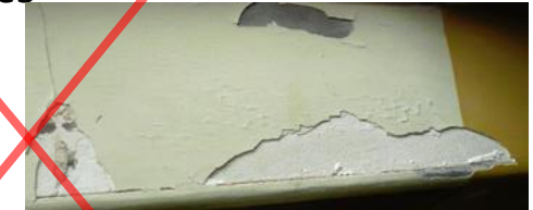
Plâtre contenant peinture au plomb